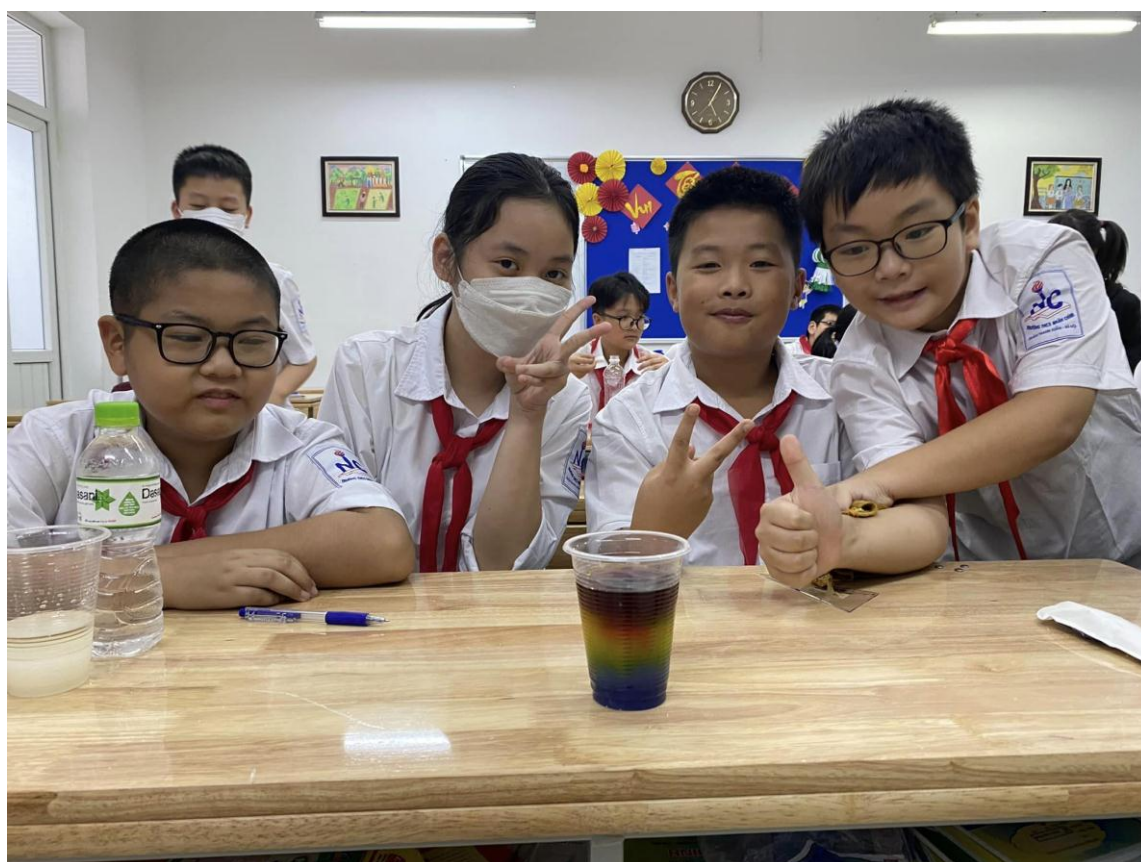
Chúng em hào hứng khi tham gia học môn Khoa học tự nhiên